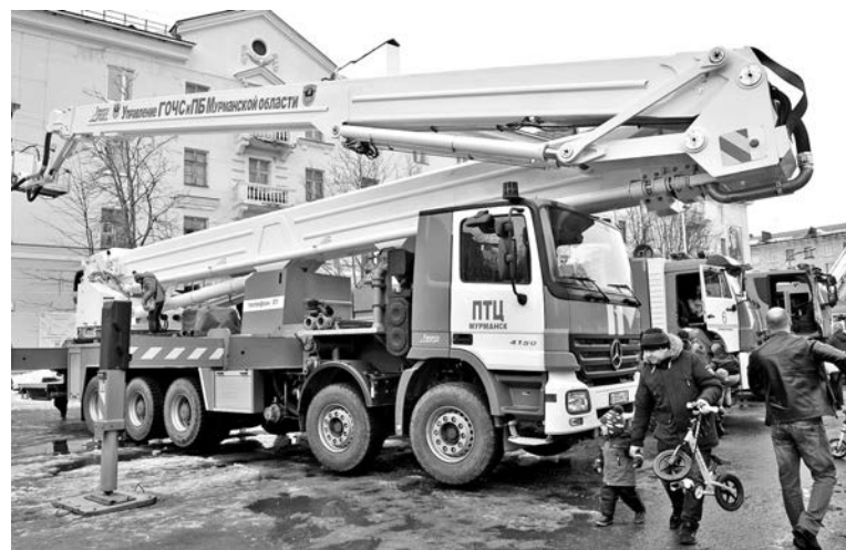
Единственный в Мурманской области пожарный автомобиль, способный достать до самого верхнего этажа гостиницы «Арктика».