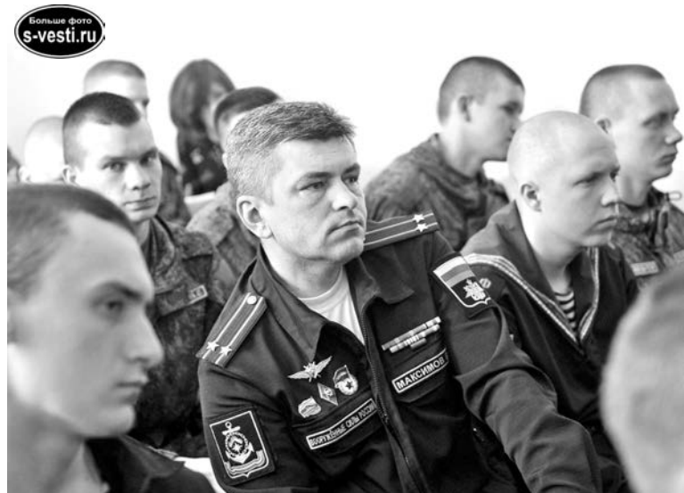
Зрители явно сопереживали докладчикам, ведь выступали их сослуживцы или подопечные.