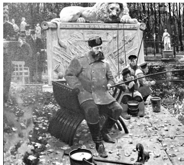
«Александр III Миротворец».