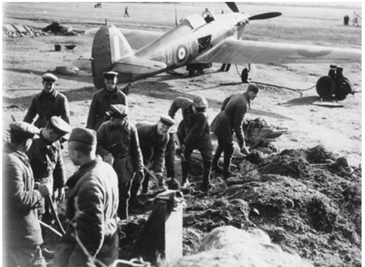
Аэродром Ваенга не имел твердого покрытия.

Материалы предоставлены СМВК. Фото из архива СМВК.