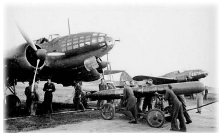
Торпедоносец Ил-4Т готовят к боевому вылету.

аэродромах около 100 немецких самолетов. Н.Г.Кузнецов разрешил наносить удары авиацией по сосредоточению неприятельских ВВС на территории Норвегии. По документам 72-го авиаполка с 22 июня прослеживаются активные действия ВВС СФ по разведке и бомбардировке аэродромов Хебуктен, портов противника Вардё, Киркенес, Лиинахамари.