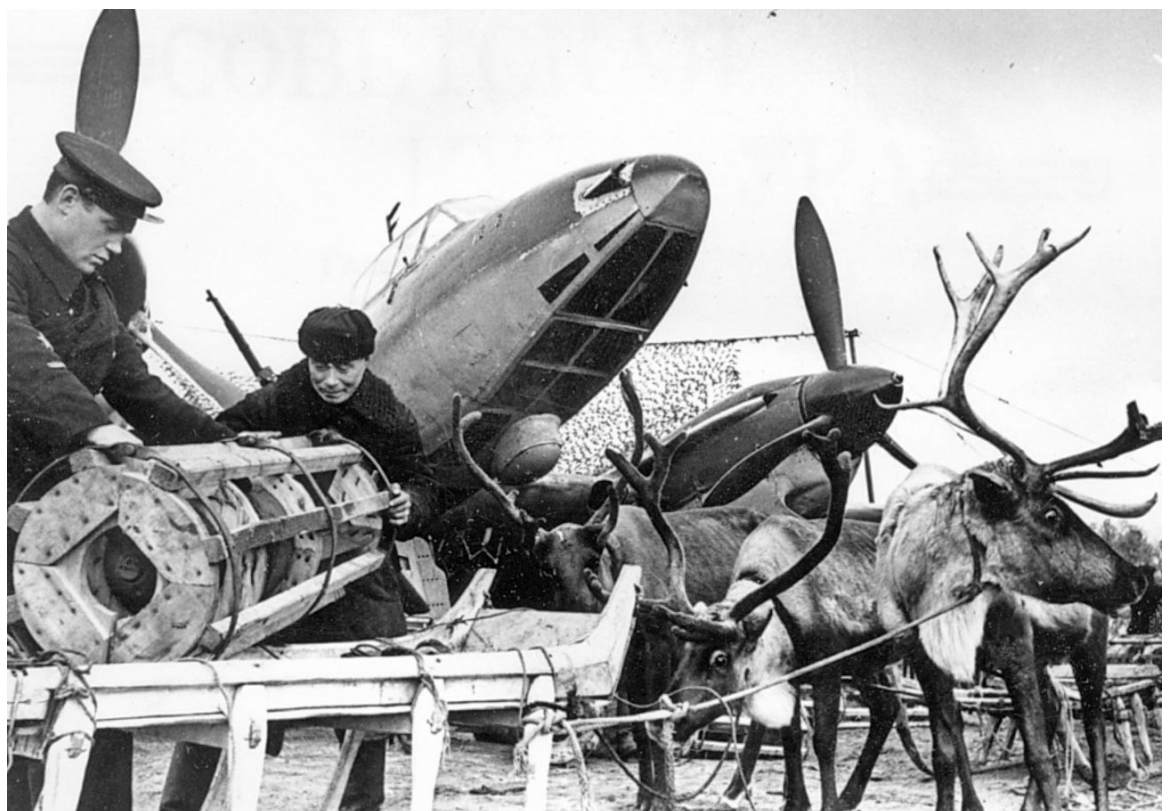
Боеприпасы на аэродром Ваенга доставляли на оленьих упряжках.