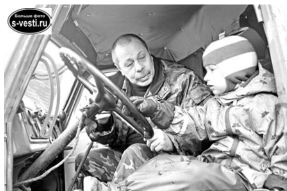
Самыми активными посетителями выставки пожарной техники были юные североморцы. Возможно, кто-то из них в будущем тоже станет пожарным.