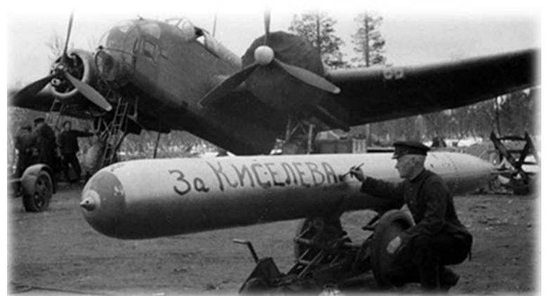
Торпедоносец «Хэмпден» 24-го минно-торпедного полка.