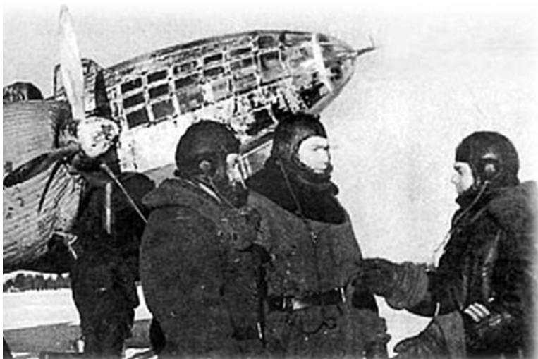
Самолет Ил-4 из состава 24-го минно-торпедного полка.