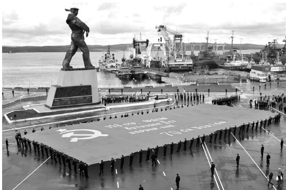
«Алеша» всегда в центре основных городских мероприятий. Вот и 26 мая 2016 года у его подножья была развернута самая большая копия Знамени Победы.